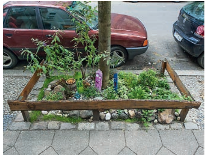
Dienst am Nächsten: Stadtbäume pflegen, Baumscheiben sanieren und bepflanzen