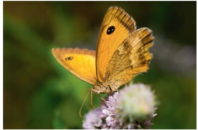
Ein insektenfreundlicher Garten wie aus dem Bilderbuch und ein Großes Ochsenauge

und Kugeldistel. Auch Himbeeren, Brombeeren, Wildrosen, Liguster, Heckenkirsche, Weigelien und Fingerstrauch verwandeln sich zur Blütezeit in ein summendes Bienenparadies.