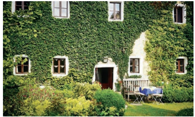
Häuser im grünen Pelz: Ob Efeu oder wilder Wein, die Auswahl ist abhängig von der Art des Hauses

größer: Waldreben, Kletterhortensie, Geißblatt, Hopfen, Kletterrosen, Spalierobst und Brombeeren. Dabei ist zwischen Selbstklimmern und Schlingpflanzen zu unterscheiden. Letztere benötigen eine Kletterhilfe. Diese sollte wetterfest sein, um nicht alle paar Jahr erneuert werden zu müssen.