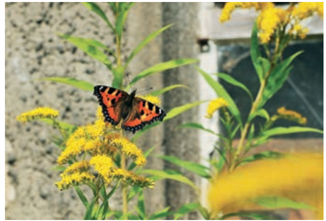
Ein Würfelfalter am Berg-Habichtskraut und ein Kleiner Fuchs an einer nektarreichen Goldrute