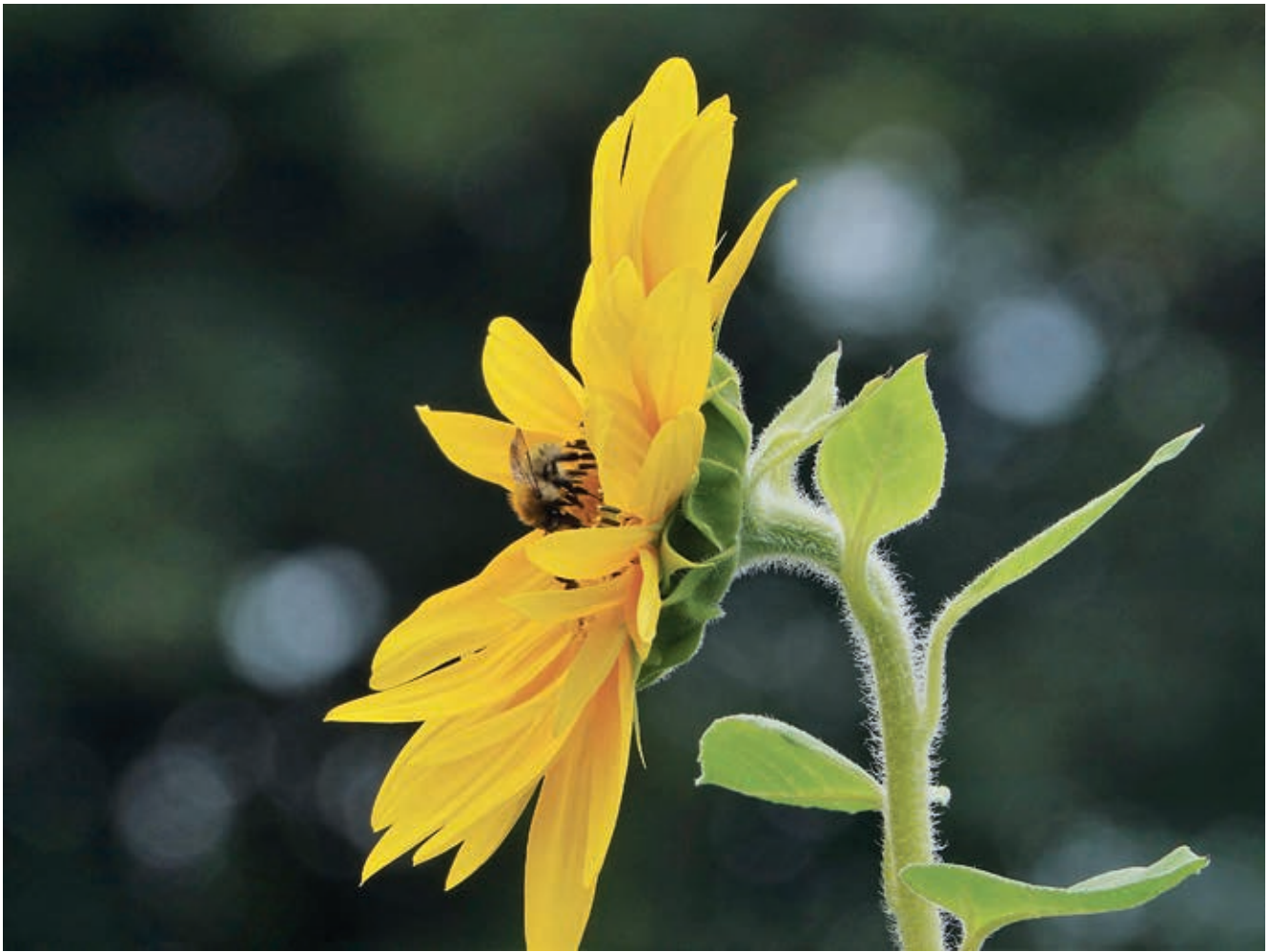
Insekten- und Augenweide im Sommer, Vogelrestaurant im Winter: die Sonnenblume

misch-synthetische Pestizide und Mineraldünger eingesetzt. Monokulturen sind üblich, die Fruchtfolgen sind sehr eng. Ackerrandstreifen, Hecken und Feldraine, die wichtige Lebensräume für Insekten sind, fehlen häufig. Um das Insektensterben zu stoppen, ist ein Richtungswechsel in der Agrarpolitik notwendig. Bäuerinnen und Bauern müssen zukünftig bei Umweltmaßnahmen unterstützt werden. Agrarsubventionen sind öffentliche Gelder. Diese sollten nur für öffentliche Leistungen gezahlt werden, also für den Schutz von Artenvielfalt, Gewässern, Böden und des Tierwohls. Der Ökolandbau muss weiter unterstützt und ausgebaut werden.