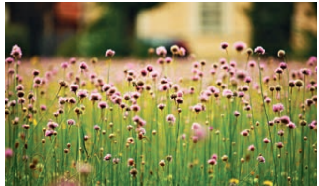
Rotgelber Weichkäfer und eine Wiese mit Sandgrasnelken – eine Einladung