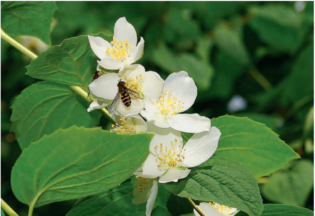
Eine Große Schwebfliege besucht eine Brombeerblüte