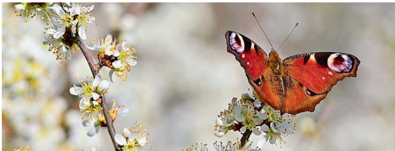
Tagpfauenauge an Kirschblüte