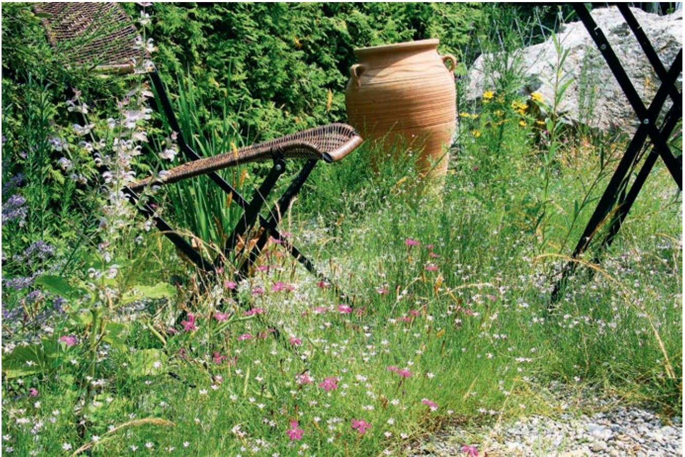
Ein warmer Kiesgarten, einladend auch für Insekten

lichen Tierarten Nahrung bietet, ist eine Heckenpflanzung aus möglichst vielen verschiedenen Straucharten besonders wertvoll, schmückt den Garten und bietet darüber hinaus noch genügend Sichtschutz.