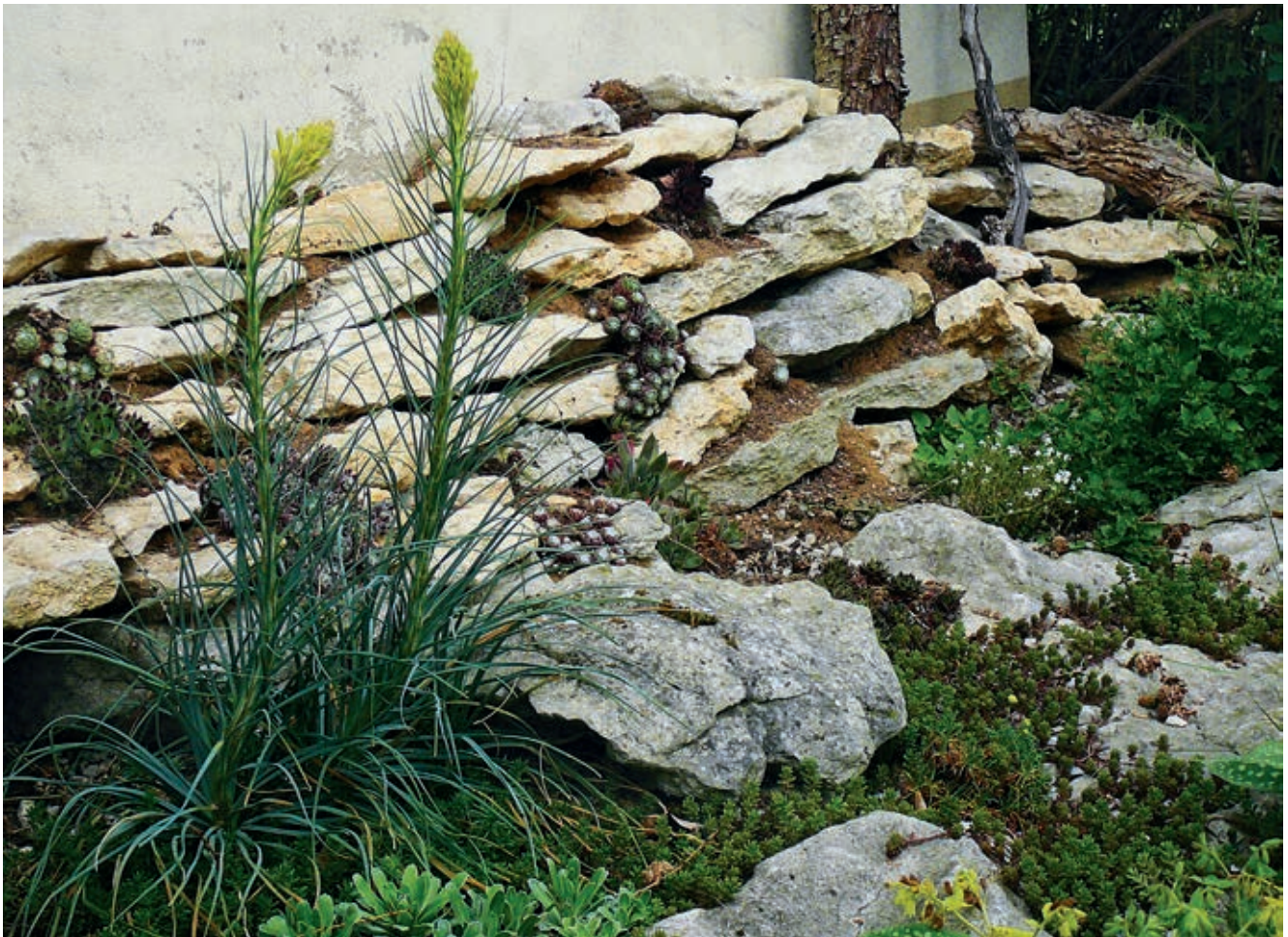
Ein paar Steine, magere Erde dazwischen, ein wenig Steinbrech: Lebensraum für Sandbienen und Sandwespen

jährigen Blumen, Stauden und Sträuchern immer darauf, dass es einheimische, robuste Sorten sind. Kaufen Sie möglichst regional erzeugte Pflanzen in Bio-Qualität. Denn viele Zierpflanzen werden in afrikanischen oder lateinamerikanischen Ländern vorgezogen und ihr Transport erzeugt vermeidbare CO 2 -Emissionen. Auch werden dort zum Teil Pestizide eingesetzt, die in Europa aufgrund ihrer hohen Giftigkeit seit vielen Jahren verboten sind. Die Arbeiter*innen auf den Plantagen und in den Gewächshäusern sind damit einer großen gesundheitlichen Gefahr ausgesetzt. Ob aus dem In- oder Ausland: Pflanzen, die während der Aufzucht mit Insektiziden behandelt wurden, können immer noch ein Risiko für heimische Insekten darstellen, da Nektar und Pollen Rückstände von diesen Giften enthalten können.