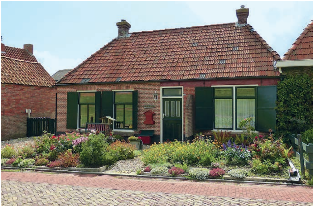
Auch ein „ordentlicher“ Vorgarten mit Kies und Kanten kann insektenfreundlich sein

werden, denn diese fressen die Insektenlarven und verschlechtern gerade in kleineren Gewässern die Wasserqualität.