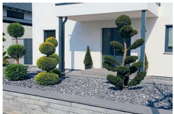
Immer noch nicht ganz ausgestorben: „Gärten des Grauens“ – Relikte aus der Steinzeit und völlig nutzlos für Insekten

nur ein oder zwei Mal im Jahr gemäht werden. Für eine insektenfreundliche Bepflanzung des Vorgartens eignen sich Kräuter wie Thymian, Salbei und Lavendel, die genügsam, attraktiv und lecker sind. Stauden sind dankbare und dauerhafte Pflanzen, die, einmal am richtigen Standort gepflanzt, viele Jahre den Vorgarten schmücken können und sich auch selbst vermehren. Zu den insektenfreundlichen Arten zählen Wiesensalbei, Katzenminze, Sonnenhut, Leinkraut, Aster, Anemone, Glockenblume, Stockrose