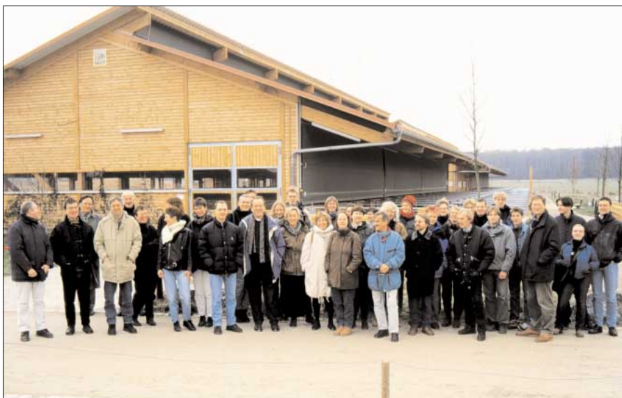
Die MitarbeiterInnen des BUND-Landesverbandes bei einer zweistündigen Führung durch die Herrmannsdorfer Landwerkstätten am Kronsberg bei Hannover.

tragungsgefahr durch Besucherinnen und Besucher klein zu halten, markiert rot-weißes Flatterband den Weg, den wir bei der knapp zweistündigen Führung über das Betriebsgelände gehen dürfen. Die Ställe sind vorsorglich ganz gesperrt. Deshalb müssen wir uns mit einem Einblick in die tiergerechten Ställe mit Auslauf für Kühe, Rinder, Schweine,