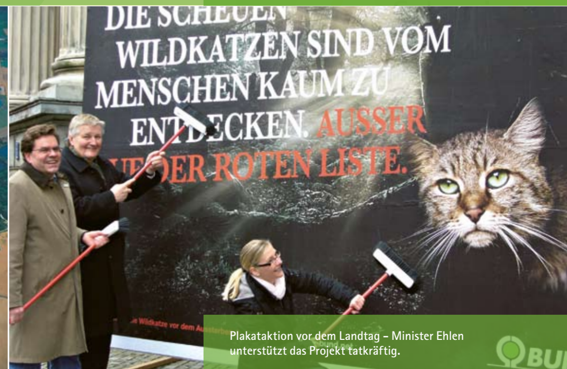
Plakataktion vor dem Landtag – Minister Ehlen unterstützt das Projekt tatkräftig.