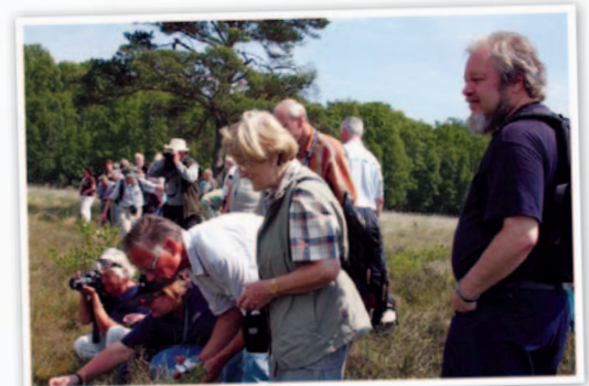
Exkursion im Jahr 2009