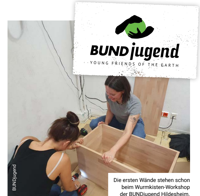
Die ersten Wände stehen schon beim Wurmboxen-Workshop der BUNDjugend Hildesheim.

Gleichgesinnte treffen. Sich einbringen. Etwas lernen. Etwas verändern. Es gibt viele Gründe, warum junge Menschen zu unseren Treffen kommen oder eine neue Gruppe gründen. Unsere Ortsgruppen treffen sich regelmäßig und entscheiden gemeinsam, was sie als Nächstes machen wollen.