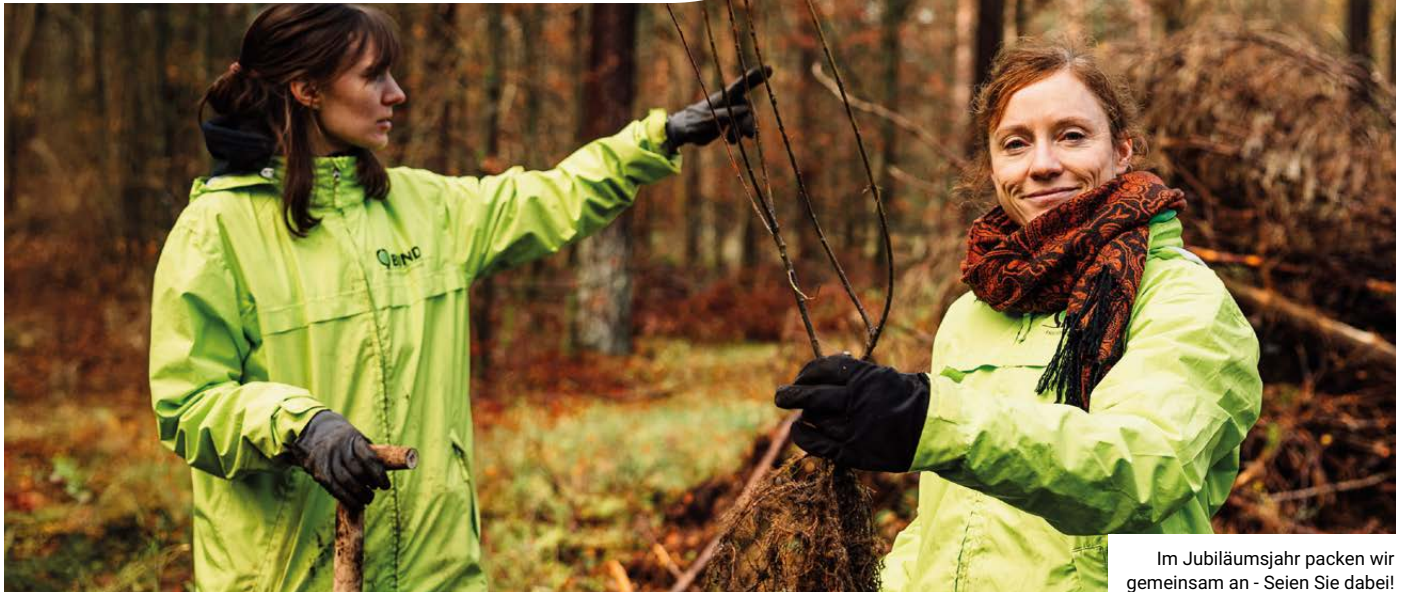
Im Jubiläumsjahr packen wir gemeinsam an - Seien Sie dabei!