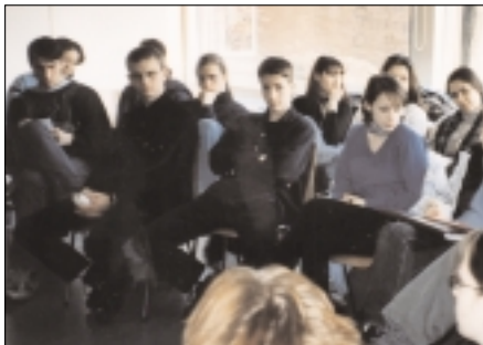
Jugendliche aus ganz Europa machen sich Gedanken über die Städte der Zukunft

■ Knapp 50 junge Menschen aus 16 Ländern beschäftigten sich eine Woche lang in Hannover mit dem Thema Nachhaltige Stadtentwicklung. Zeitgleich zu dem „Erwachsenen-Treffen“ mit dem Titel „Dritte Europäische Konferenz Zukunftsbeständiger Städte und Gemeinden“ vom 9. bis 12. Februar machten sich die Jugendlichen, unter anderem aus Russland, Polen, Italien, Tschechien, England, Finnland ihre eigenen Gedanken über die Stadt der Zukunft. So unterschiedlich die Meinungen auch waren, einig waren sich