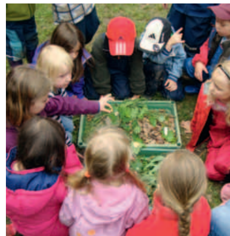
Die Kreisgruppe Nienburg will Natur für Stadtkinder schaffen.

Am Ende des dreijährigen Modellprojekts will die BUND-Gruppe einen Leitfaden mit wertvollen Tipps herausgeben, wie sich auch in anderen Städten Naturspielräume schaffen lassen – damit Kinder und Jugendliche auch in der Stadt Natur erleben können. Die Niedersächsische Bingo-Umweltstiftung fördert das Projekt finanziell, und die Stadt Nienburg stellt das Gelände zur Verfügung.