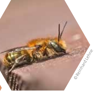
Eine hübsche Bewohnerin von Hohlräumen ist die »Stahlblaue Mauerbiene«.