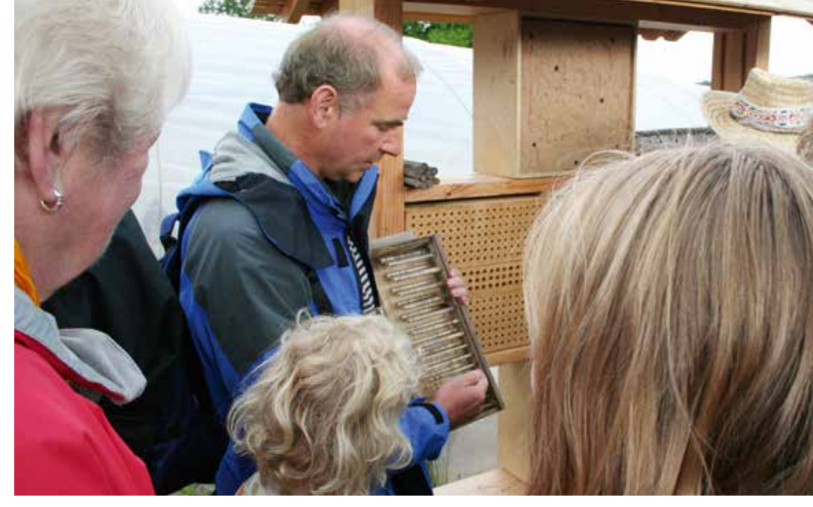
Anhand von Beobachtungskästen lässt sich die Entwicklung der Bienen gut nachvollziehen.

In der Natur besiedeln manche Wildbienenarten gerne vorhandene Hohlräume, insbesondere Fraßgänge von Käfern oder Holzwespen in abgestorbenem Holz. Im besten Fall bieten wir diesen Arten entsprechendes Totholz zum Nisten an. Manche dieser Arten suchen auch Ersatzlebensräume im Verputz von Hauswänden oder in Fensterrahmen auf. Wer gerne selbst etwas basteln möchte, kann einfache Modelle aus Holz und hohlen Pflanzenstängeln bauen, die zumeist gut angenommen werden. Anleitungen dazu finden Sie auf dem Poster im Mittelteil dieser Broschüre.